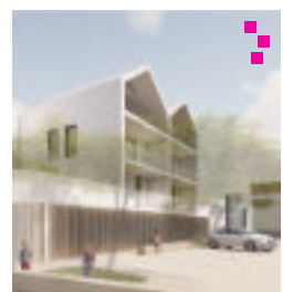
URBANISME Aménagement place Jean Jaurès