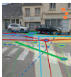
TRAVAUX À compter du 1er semestre 2023