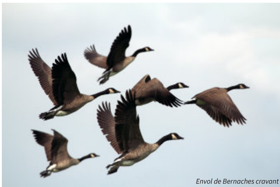
Envol de Bernaches cravant

Les accès à la côte seront bien évidemment toujours ouverts aux habitants.