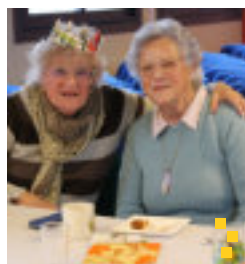
VIE SOCIALE Goûter convivial