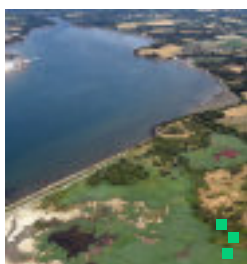
BLAVET AU NATUREL Du 24 mars au 2 avril 2023