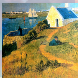
HISTOIRE DE L'ART