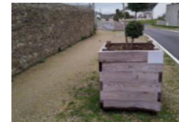
Bacs à fleurs en bois

Avec SOS Rivages, prenons soin de nos côtes et recyclons les mégots de cigarettes.